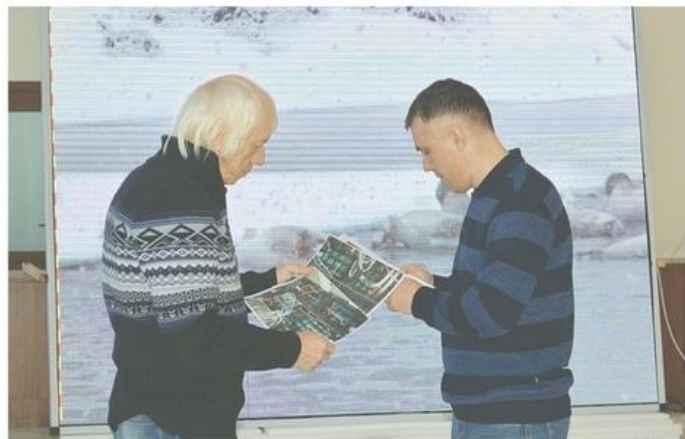
Купитработники районного Дома культуры проверяют теплическое состояние экрана

Средства в размере 491 446 рублей выделили из областного и районного бюджетов