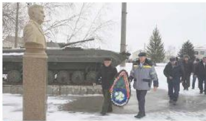
Ветераны-десантники нашего района возложили венок и бюсту командующего ВДВ Василия Маргелова

— 27 декабря легендарному командующему Воздушно-десантными войсками Василию Маргелову исполнилось бы 115 лет, — сказал Александр Медведев, председатель Союза десантников России Южного федерального округа Воронежской области. — Родившись в простой семье, он всю жизнь посвятил военному делу и превратил Воздушно-десантные войска