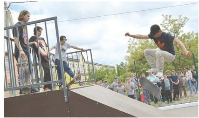
На открытии скейт-парка в Петропавловку приехали воронежские скейтбордисты

На открытии скейт-парка в Петропавловке воронежские скейтбордисты показали мастер-класс