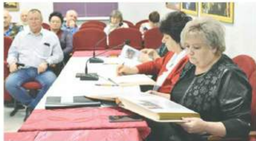
► Be open to critical analysis

В конце января в рамках подготовки к 80-летию Победы в Великой Отечественной войне 1941–1945 годов, провели смотр-конкурс первичных ветеранских организаций Петропавловского района на звание «Лучшая первичная организация ветеранов».