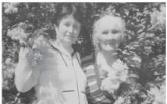
© International Organization for Migration, 2007. Reproduction is permitted.

© 1993 by the American College of Podiatric Chiropractic