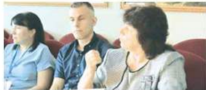
На заседании круглого стола

Чтобы патриотическая работа на территории Петропав-