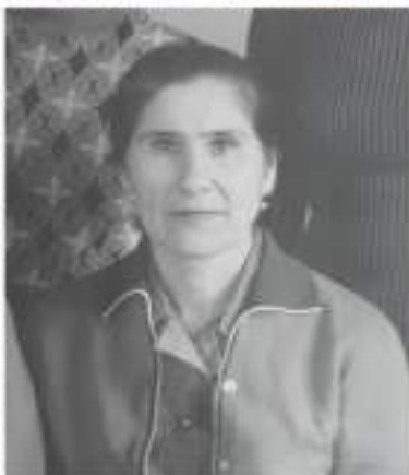
© 2004 Blackwell Publishing Ltd Journal of Internal Medicine 255: 105–112

Объем вылова рыбы в море в 1970 году составил 483 миллиона, на 1971 год — 761. Рыба добывается главным образом в открытом — исключая консервированную — море, а не в прибрежных водах. В декабре 1970 году появились сообщения о вылове большого количества голубых