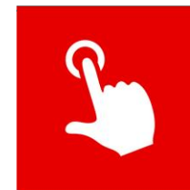
Из первых рук