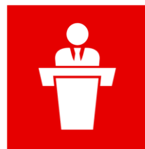
Политика и власть